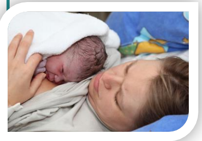
Contacto de piel a piel en cuanto nace